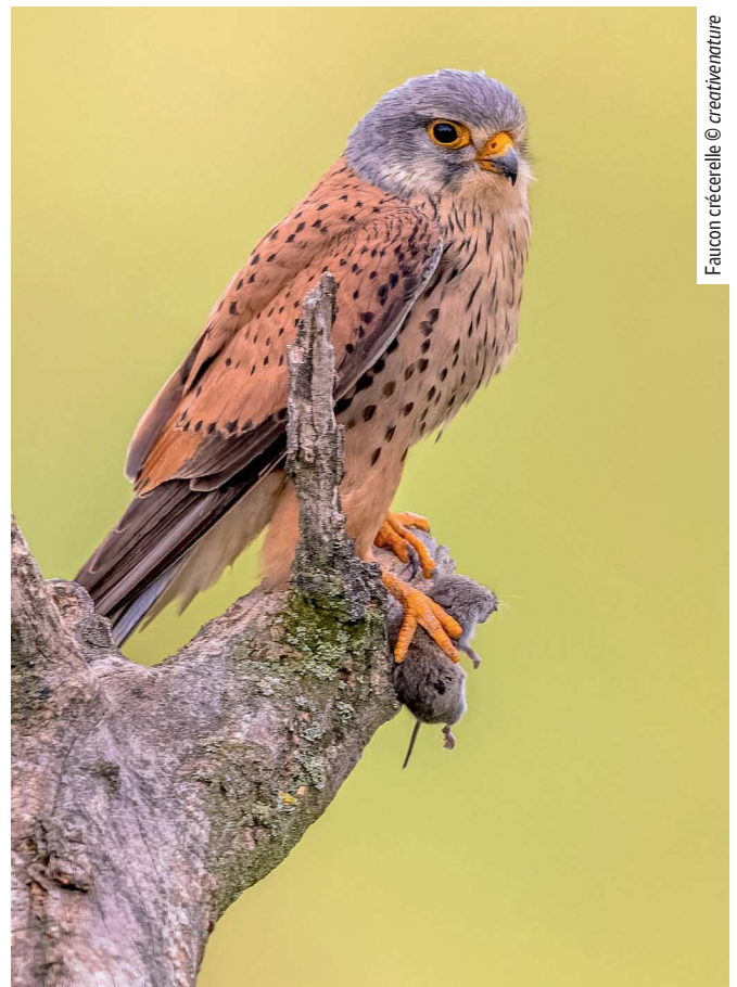
Falcon crécerelle

& al. Proceedings of the National Academy of Sciences . 29 juillet 2019. https://doi.org/10.1073/pnas.1906419116