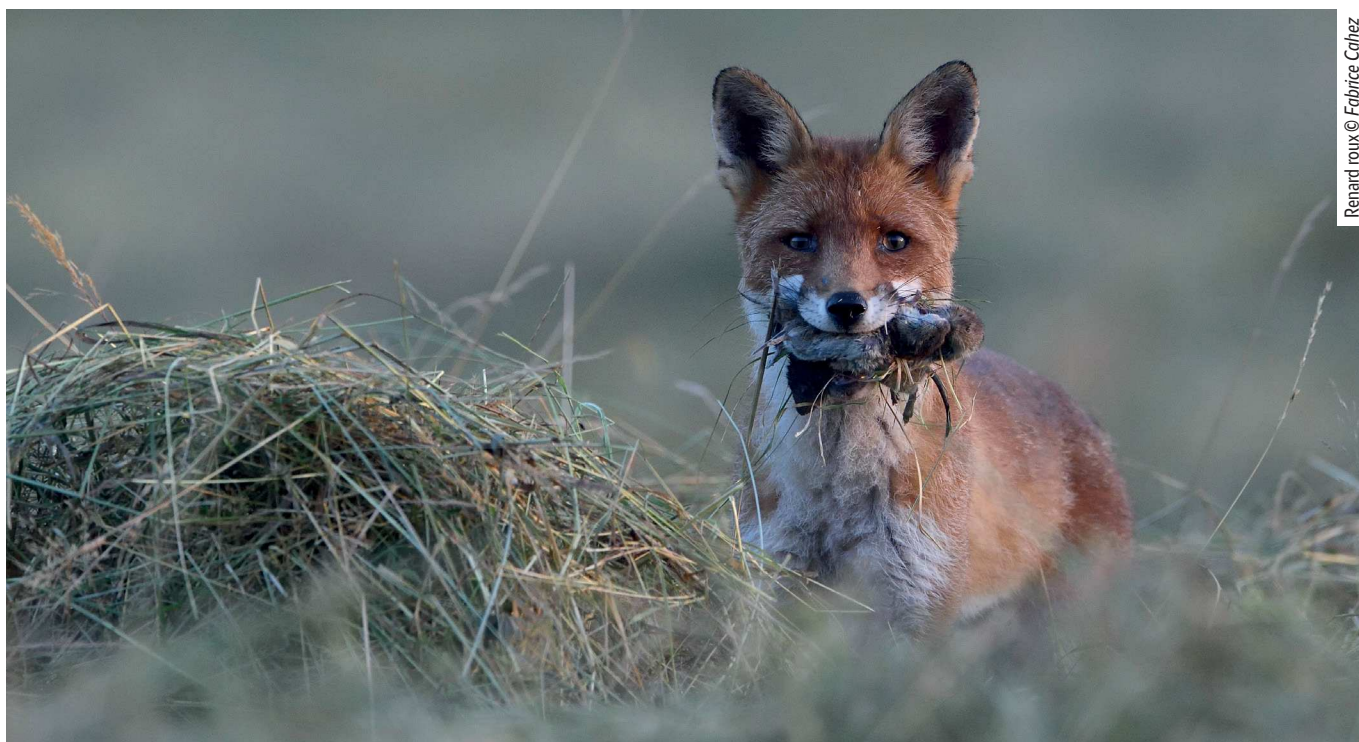
Renard roux

Afin que l'utilisation de macroorganismes « issus d'élevages » ou de produits pharmaceutiques de biocontrôle, ne contribuent pas à maintenir les agriculteurs dans une certaine forme de dépendance vis-à-vis de leurs conseillers et de leurs fournisseurs, il convient d'utiliser en priorité la lutte biologique par conservation. En utilisant les services rendus par les auxiliaires de cultures présents naturellement et gratuitement, elle permet une certaine autonomie et résilience des fermes.